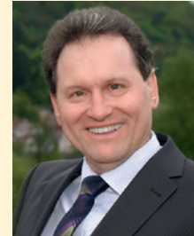
Liebe Mitbürgerinnen, liebe Mitbürger,

mit der Inbetriebnahme des neuen Haltepunktes Kleingemünden geht ein mehr als drei Jahrzehnte gehegter Wunsch der Stadt Gemünden a. Main in Erfüllung. Eigentlich ist es ja kein neuer Haltepunkt, sondern eine Reaktivierung an einem neuen Standort. Bis zum Jahre 1976 bestand in diesem Bereich, unweit vom jetzigen Standort, bereits ein Haltepunkt Kleingemünden der Bahnstrecke Gemünden – Bad Kissingen.