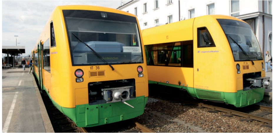
Die Oberpfalzbahn in Cham

Bahnübergänge technisch sichern oder auflassen, wozu die Mitwirkung der Kommunen erforderlich ist.