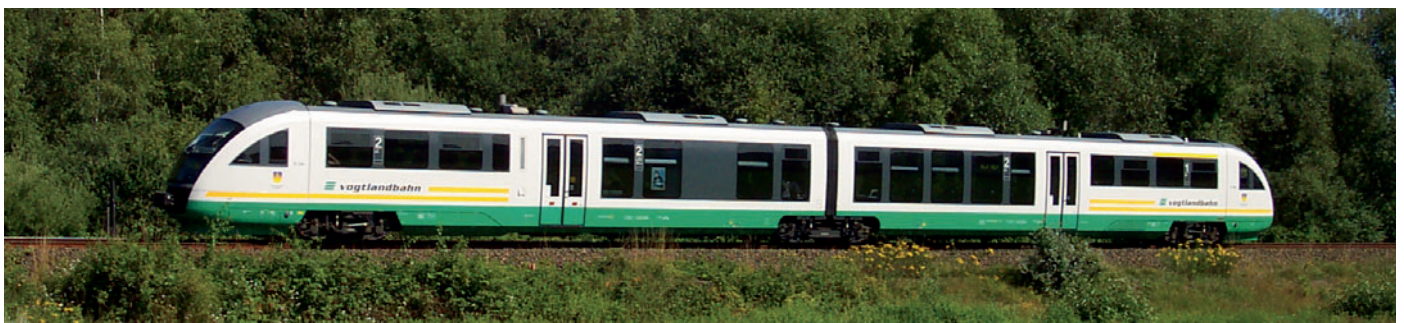
Das Fahrzeug „Desiro“ unterwegs auf der Naabtalbahn bei Schwarzenfeld

Fahrgäste aus dem Naab- und Waldnaabtal nördlich von Schwandorf profitieren von neuen stündlichen statt bislang zweistündlichen Direktverbindungen nach Regensburg und zusätzlichen Zügen in der Hauptverkehrszeit und am Abend. Am Wochenende werden die Regionalzug-Halte im Abschnitt Regensburg – Weiden stündlich, im Abschnitt Weiden – Marktredwitz zweistündlich bedient. Auch sollen die Reisezeiten durch kürzere Haltezeiten in den Knotenbahnhöfen Weiden und Schwandorf beschleunigt werden. Von Schwarzenfeld, Nabburg und Wernberg nach Regensburg werden Fahrgäste beispielsweise künftig zehn Minuten, von Windischeschenbach und Altstadt nach Schwandorf etwa sieben Minuten schneller unterwegs sein.