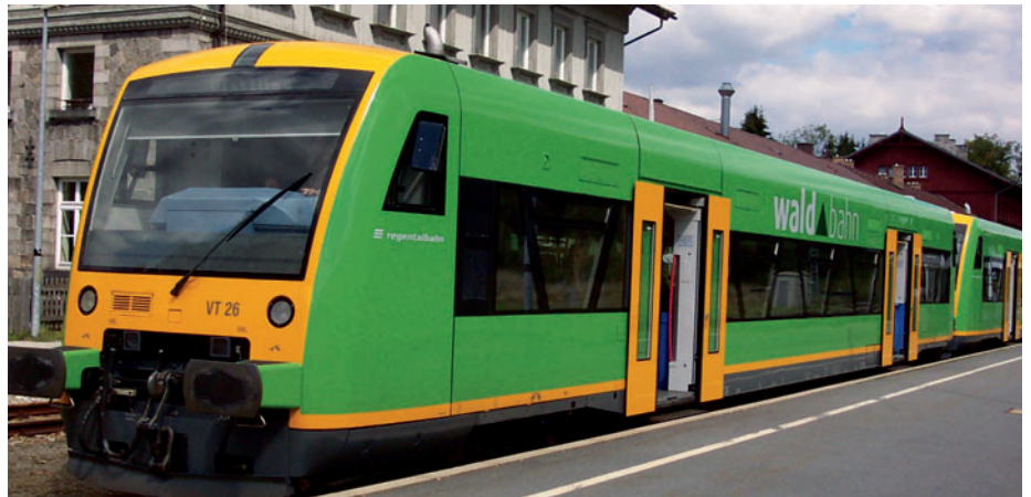
Die Waldbahn in Bayerisch Eisenstein

Bahnübergänge technisch sichern oder auflassen, wozu die Mitwirkung der Kommunen erforderlich ist. Dann wird durch die bessere Verknüpfung zu den Igel-Bussen in Spiegelau der gesamte Nationalpark Bayerischer Wald optimal erreichbar und die Tourismusregion Ostbayern noch attraktiver.