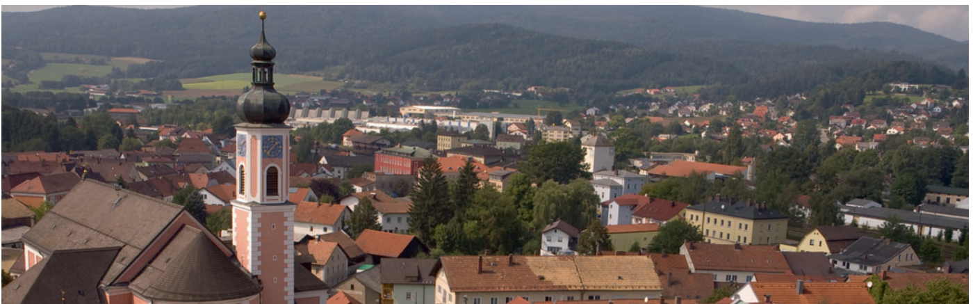
Verbesserte grenzüberschreitende Verbindungen sind auch in Furth im Wald geplant

an die Vergabe in Bayern mit den tschechischen Stellen geregelt werden. Entsprechende Absprachen wurden im Vorfeld mit den Bezirken Karlsbad und Pilsen getroffen.