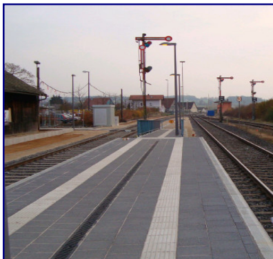
Neuer Mittelbahnsteig Vilseck