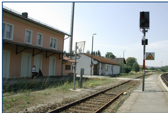
Bahnhof Roding – Mittelbahnsteig