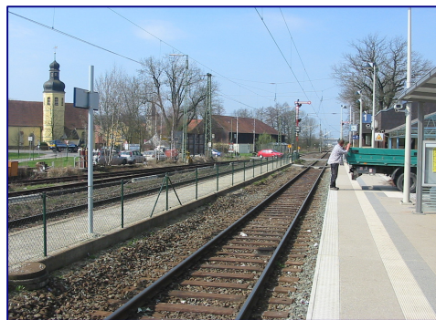
Rödental: Blick auf alten Bahnsteig Gl. 2