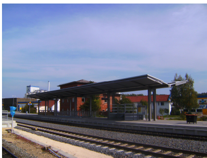
Bf. Neuhaus /Pegnitz