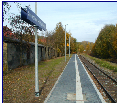
Neuer Bahnsteig in Simmelsdorf-Hüttenbach