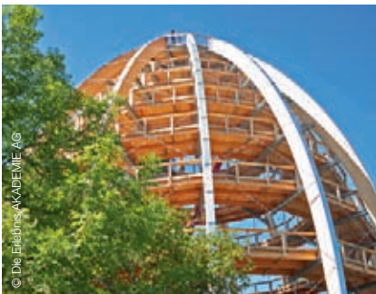
Baumwipfelpfad in Neuschönau