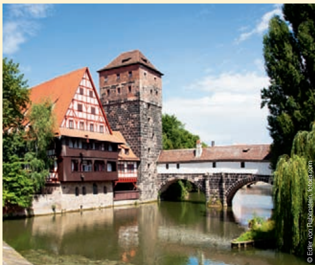
Blick auf die Nürnberger Altstadt mit Henkerturm

* RB 57397 hält an allen Unterwegsbahnhöfen, RB 57396 hält nicht in Langenwang und Martinszell