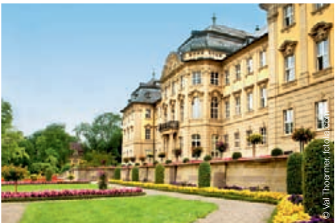
Außenansicht des Schlosses Werneck