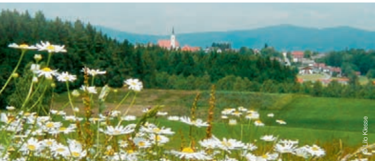
Eging am See