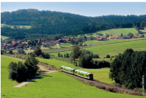
Tourismusverkehr auf der Ilztalbahn