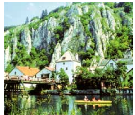
Von der Donautalbahn aus erreichen Aktivurlauber das Altmühltal ganz problemlos.

Der Donautalbahnstation Neuburg an der Donau befindet sich in der Nähe der schönen historischen Altstadt. Schon von weitem ist die prächtige Schlossfassade mit den zwei markanten Rundtürmen zu erkennen. Die Stadt liegt landschaftlich reizvoll im Donautal an der Grenze zwischen Fränkischer Alb im Norden sowie Donaumoos und Hügelland im Süden. Neuburg gilt als eine der schönsten Renaissance-Städte Bayerns. Im Jahr 2005 wurde im Schloss die Staatsgalerie Flämische Barockmalerei eingerichtet. Sie