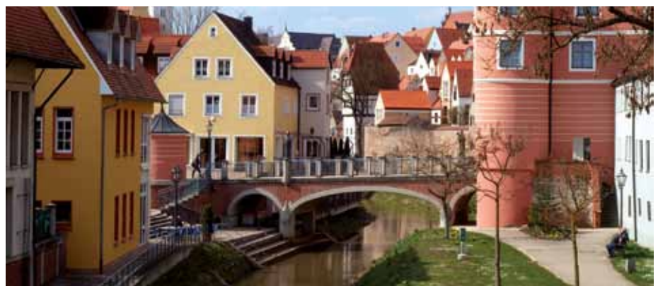
Im Auftrag der BEG ermöglicht agiliss auf der Donautalbahn schnellere Verbindungen, z. B. nach Donauwörth.

Mit der zweiten Betriebsstufe bietet agiliss im Auftrag der BEG auf der Donautalbahn ein nochmals verbessertes Angebot. Ab 11. Dezember 2011 profitieren die Fahrgäste von zusätzlichen Zügen in den Abendstunden und im Berufsverkehr. Erstmals verkehren die Züge im Donautal auch am Wochenende jede Stunde. Zusätzlich zu den Regionalzügen, die weiterhin zweistündlich jede Station entlang der Donautalbahn bedienen, verkehren neu alle zwei Stunden Expresszüge. Sie verbinden auf der über 200 Kilometer langen Strecke die drei Großstädte Regensburg, Ingolstadt und Ulm sowie die fünf Kreisstädte Neu-Ulm, Günzburg, Dillingen, Donauwörth, Neuburg (Donau) und Saal als Halt für die benachbarte Kreisstadt Kelheim in nur etwa zweieinhalb Stunden. Damit sind Fahrgäste rund eine Stunde schneller unterwegs als in den Regionalzügen mit insgesamt 32 Zwischenstopps und einer Fahrzeit von etwa dreieinhalb Stunden.