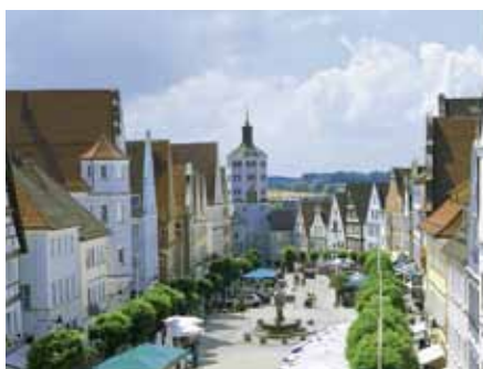
Ein liebevoll sanierter Stadtkern mit zahlreichen Gastronomieangeboten macht Günzburg zu einem touristischen Höhepunkt entlang der Donau.

Die Geschichte der Stadt Günzburg ist geprägt von einer über 500-jährigen Zugehörigkeit zum Haus Habsburg. Vor allem die Altstadt beeindruckt ihre Besucher: Ein liebevoll sanierter und weitgehend verkehrsberuhigter Stadtkern mit nahezu 200 Baudenkmälern und einer großen gastronomischen Vielfalt lädt zum ausgiebigen Stadtbummel ein. Für Familien ist Günzburg der ideale Ausgangsort für Tagesausflüge ins Legoland, das jährlich rund 1,3 Millionen Besucher anzieht.