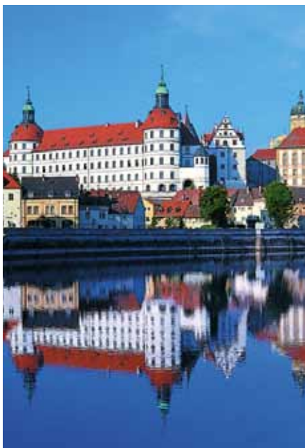
Ein echter Blickfang in Neuburg ist die beeindruckende Schlossfassade.

beherbergt 150 Werke der bedeutendsten flämischen Meister wie z. B. Peter Paul Rubens, van Dyck, Teniers, Brueghel und vielen anderen.