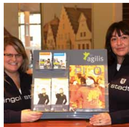
Im agilis-Kundencenter erhalten Fahrgäste neben Fahrscheinen Informationen rund um den Zugverkehr in der Region sowie Tipps zur Freizeitgestaltung.

Eine weitere Verbesserung in Sachen Qualität: Alle durchgehenden Züge auf der Donautalbahn werden von Zugbegleitern betreut – wie von der BEG gefordert. Die weiteren Züge werden je nach Auslastung begleitet. Eine 100-prozentige Besetzung auf allen bayerischen Strecken würde die finanziellen Mittel des Freistaats übersteigen. Daher ist die Mindestanzahl der geforderten Zugbegleiter abhängig von Streckennetz und Auslastung. Die BEG gibt also eine bestimmte Mindestquote vor. Wie die Zugbegleiter auf einer Strecke eingesetzt werden, liegt dann im Verantwortungsbereich des Verkehrsunternehmens: Es muss Auslastung, wie z. B. im Schülerverkehr, und Sicherheitsempfinden zu bestimmten Tageszeiten in seiner Personalplanung berücksichtigen. Die Verkehrsunternehmen können natürlich jederzeit in unternehmerischer Entscheidung mehr als die von der BEG geforderten Zugbegleiter einsetzen, um Service und Sicherheit für die Fahrgäste zu verbessern.