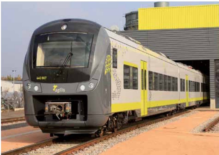
26 neue Triebfahrzeuge vom Typ Coradia Continental sorgen im E-Netz Regensburg und auf der Donautalbahn für Schnelligkeit und mehr Komfort.