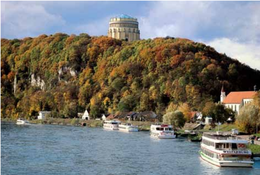
Vom Donautalbahnstation Saal erreicht man in kurzer Zeit das schöne Kelheim.

Entlang der Donau von Regensburg über Ingolstadt nach Ulm befinden sich einige der touristischen Highlights des Freistaats. Mit der Donautalbahn sind diese Ziele umweltfreundlich, unkompliziert und günstig zu erreichen – ab Dezember sogar mit deutlich verbesserten Verbindungen. Die Bayerische Eisenbahngesellschaft wünscht viel Spaß beim Staunen und Erleben, Radeln und Bootfahren, Eislaufen und Wandern!